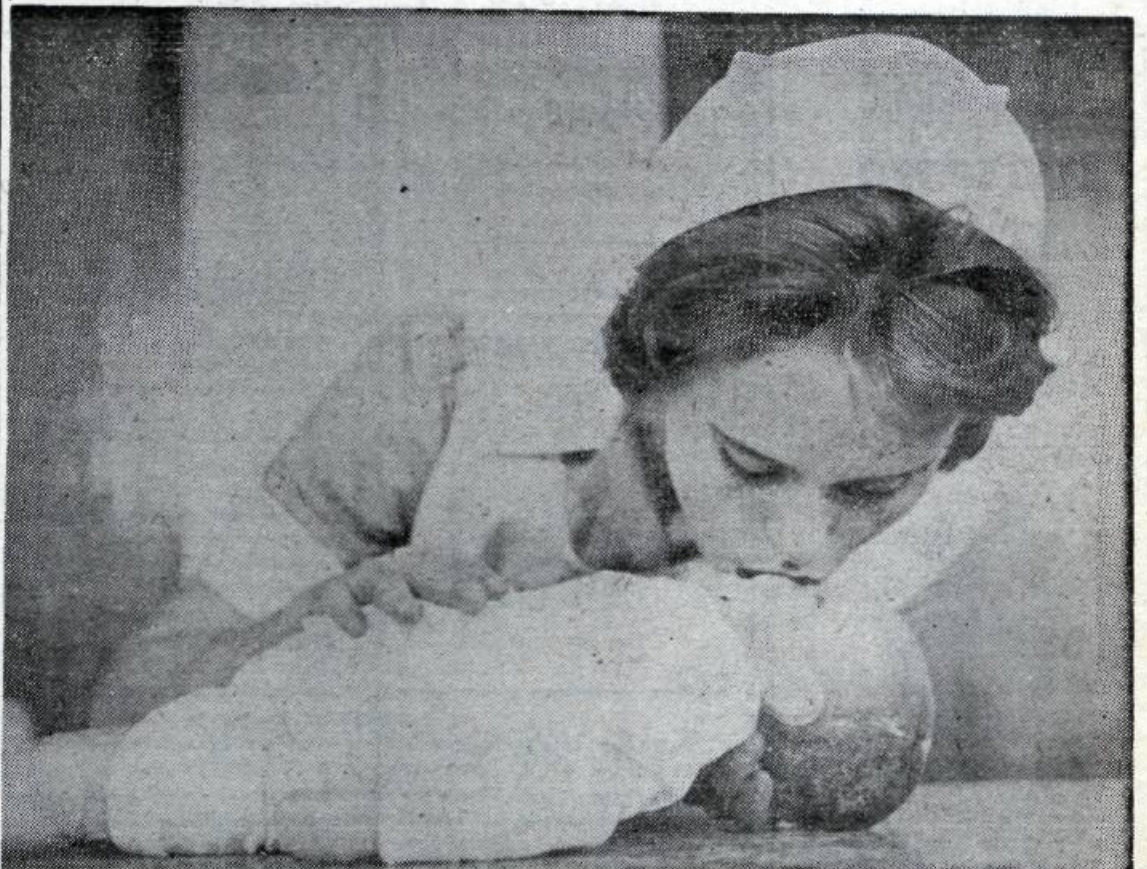
Blástursaðferðin er framkvæmd við börn að mestu á sama máta og við fullorðna. Þó er sá munur á, að hjálparmaður leggur munn sinn bæði yfir nef og munn sjúklingsins og blæs miklu vægar, allt að 20 sinnum á mín. — Hjúkrinarnemi sést hér læra blástursaðferðina á gervi-sjúklingi.

Ef komið er að manni, sem kafnað hefur af völdum kolsýrlings, rafmagns, drukknunar eða annarra ástæðna — og enginn læknir er við hendina, skulu leikmen þeir, er fyrstir koma að slíku slysi, hefja tafarlaust lífgunartilraunir á hinum kafnaða, en láta aðra, sem nærstaddir kynnu að vera, gera ráðstafanir til þess að